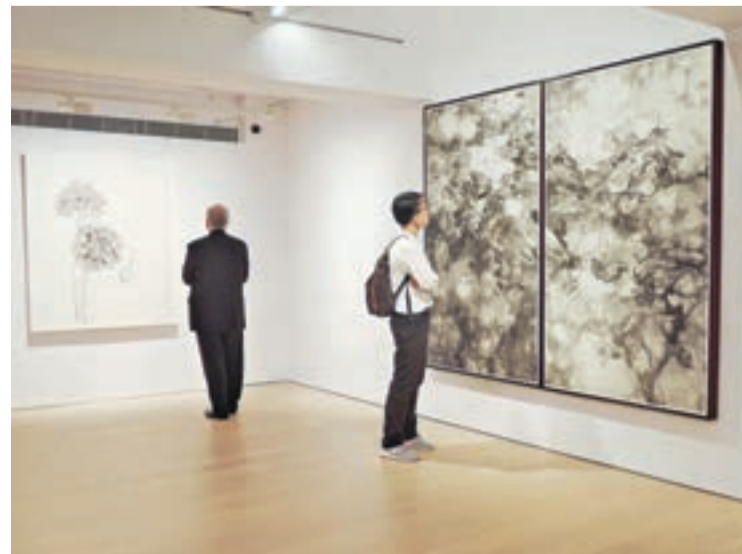
兩種不同風格的作品展現同一哲學思想。