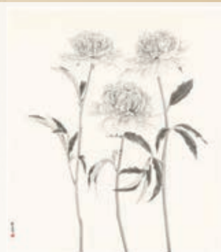
張藝蓉作品《三君子》