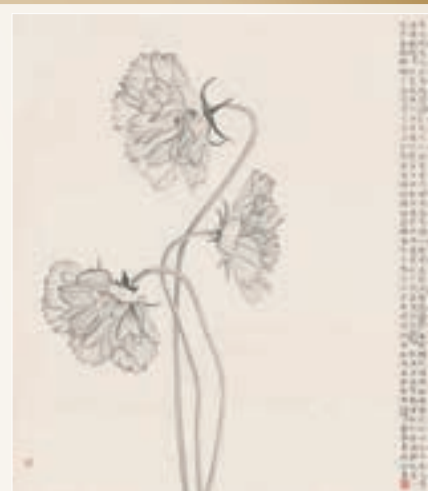
張藝蓉作品《採菊東籬》