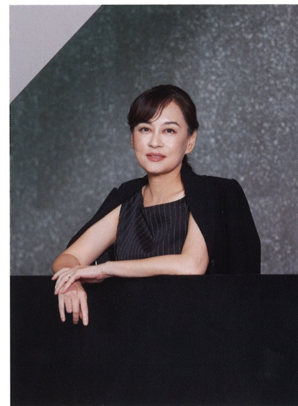
Maria認為香港藝術家有一種共同的特質，都很擅長在生活日常當中看到詩意。

濼、社交媒體令人疲憊的時代，人們已習慣了即時、震撼的視覺刺激。「你只需要在手機按幾下，就會有荷里活電影級數的震撼畫面在你眼前出現」，他認為這反而令真實的藝術體驗更顯彌足珍貴。他期待這次雙年展的展出，能夠為觀眾提供「一個讓人可以沉澱、跟自己的感知對話的機會。」